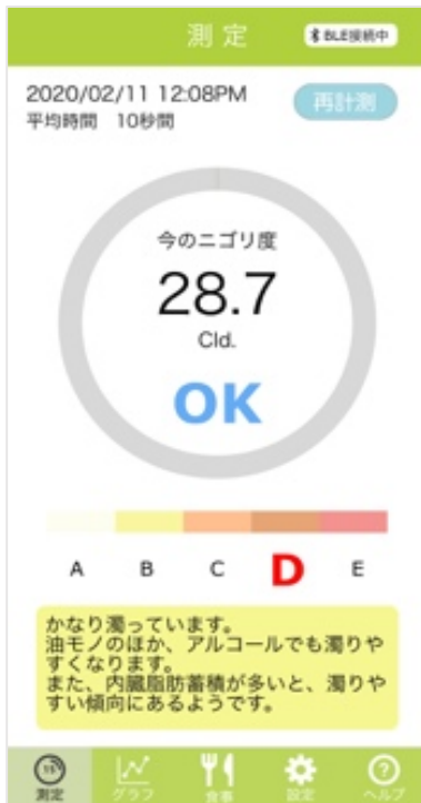
(従来)測定結果画面